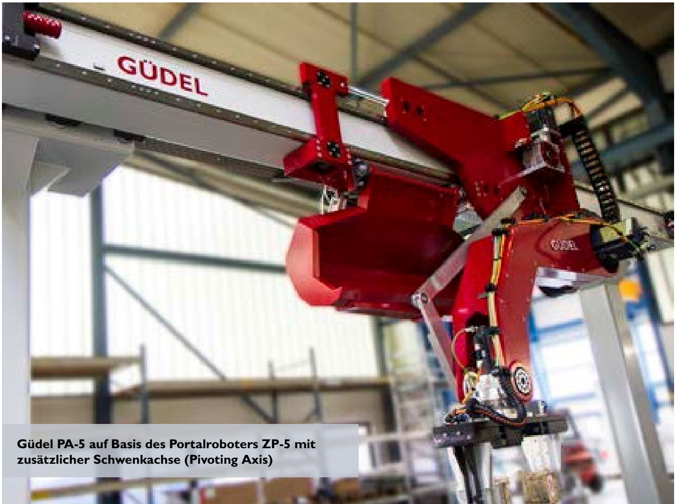
Güdel PA-5 auf Basis des Portalroboters ZP-5 mit zusätzlicher Schwenkachse (Pivoting Axis)