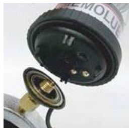
8. Enroscar el MEMOLUB® al MEMO.