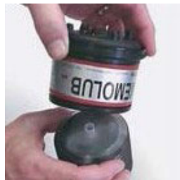
4. Retirar cuidadosamente el tapón del cartucho. Colocar la carcasa boca abajo sobre el cartucho.