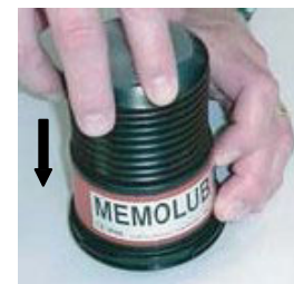
5. Girar la carcasa junto con el cartucho.