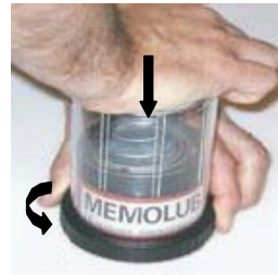
2. Para abrir, colocar el dispensador de lubricante sobre una base plana. Presionar la caperuza hacia abajo y enroscar en el anillo negro girando hacia la izquierda.