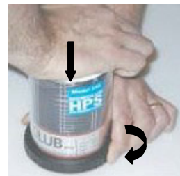
7. Presionar la caperuza hacia abajo y enroscar en el anillo negro girando hacia la derecha.