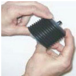
4. Expulsar cuidadosamente el aire del cartucho.