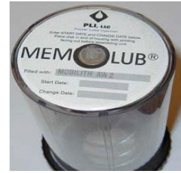
3. Retirar la etiqueta del cartucho de repuesto. Anotar la fecha de comienzo y la fecha de sustitución.