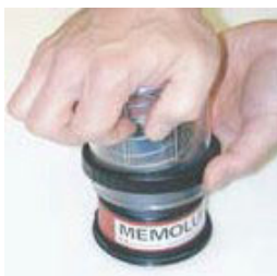
6. Colocar la caperuza por encima de la carcasa y el cartucho ya ensamblados.