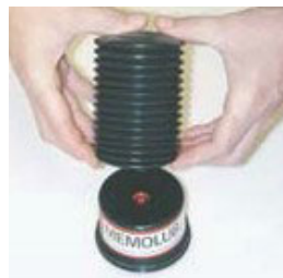
5. Colocar el cartucho en la carcasa.