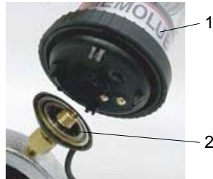
1. Desenroscar el MEMOLUB® (1) del MEMO (2). ¡El MEMO permanece enroscado al punto de servicio!